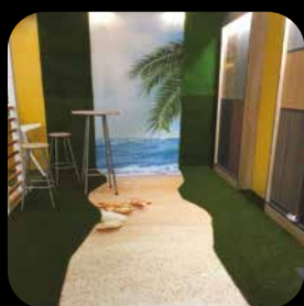
Contenus concernés par le droit d'auteur Copyrighted content