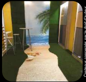
Contenus concernés par le droit d'auteur Copyrighted content