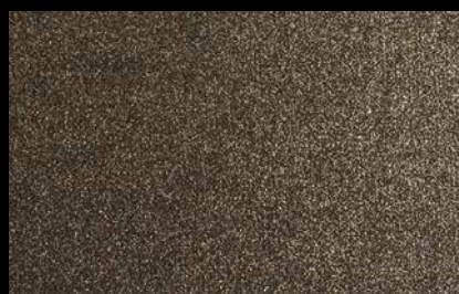
1910 Black with gold glitters