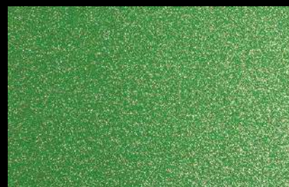
0961 Apple Green