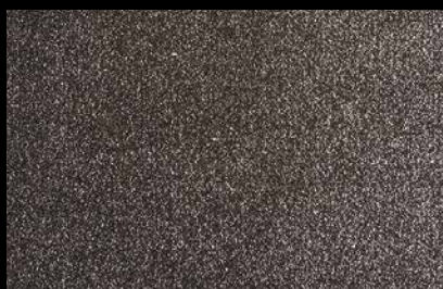
0910 Black with silver glitters