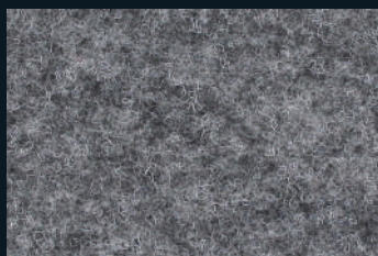
1725 Light Grey