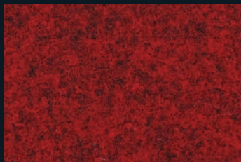
1702 Dark Red