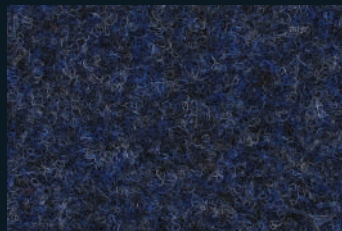
1704 Night Blue