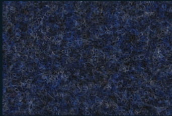
1704 Night Blue