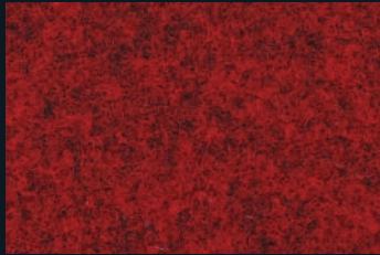
1702 Dark Red